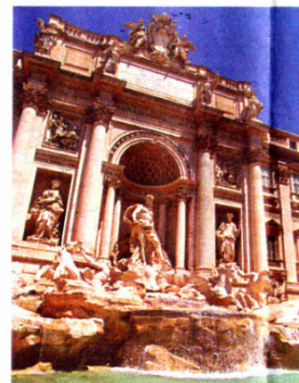
▲意大利古迹處處，圖為羅馬的許願池。

吸引的交通工具還不只是法拉利，可安排海陸空體驗，讓你搭乘私人噴射專機、豪華遊艇，總之是奢華之旅。