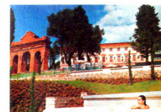
▲可安排入住世界著名的水療度假村、中世紀大莊園、古代皇室居所等。