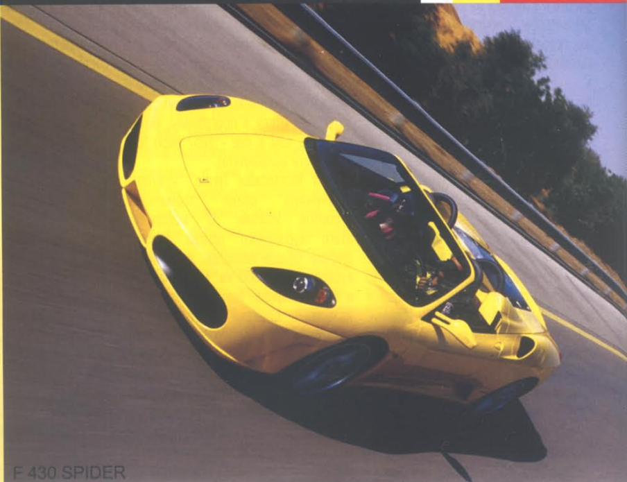
F 430 SPIDER

организована фотосъемка. Заключительный день тура перед возвращением домой полностью посвящается отдыху на частном пляже отеля.