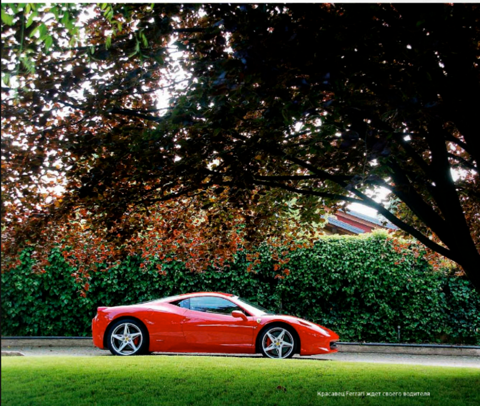
Красавец Ferrari ждет своего водителя