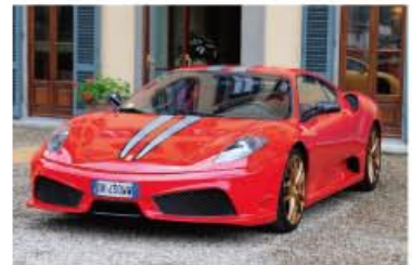
Ferrari 430 Scuderia