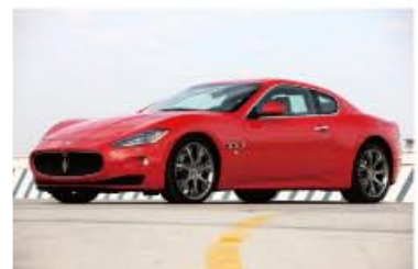
Maserati Gran Turismo