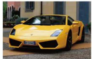
Lamborghini Gallardo LP560-4