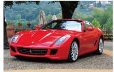
Ferrari 599 GTB Fiorano