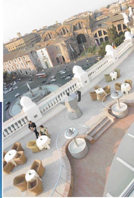
LA TERRASSE DE L'HÔTEL EXEDRA LE COLYSEE À ROME