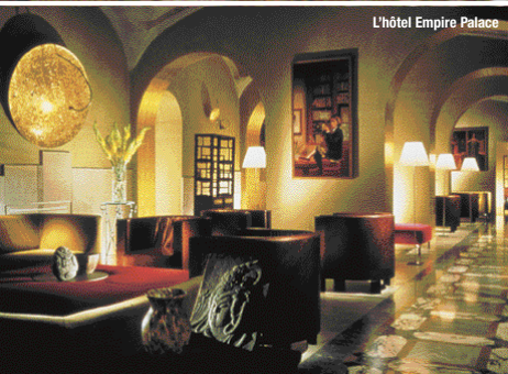
L'hôtel Empire Palace