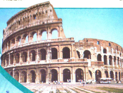
到羅馬鬥獸場參觀古迹