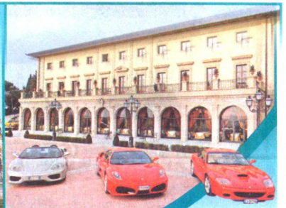
可入住世界著名的水療度假村及古代皇室的居所