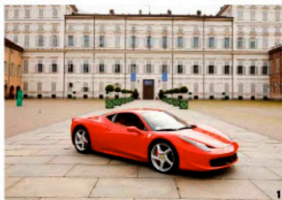
1. Элитному авто — элитную парковку 2. Горные дороги Италии созданы для истинных любителей 3. Владельцы Ferrari — искусство для ценителей

любые вопросы, возникающие по ходу поездки, а также разработают персональную схему маршрута с учетом предпочтений путешественников. Условия пребывания под стать автомобилю — остановки в 5–7-звездочных отелях, трапезы в самых уютных ресторанах.