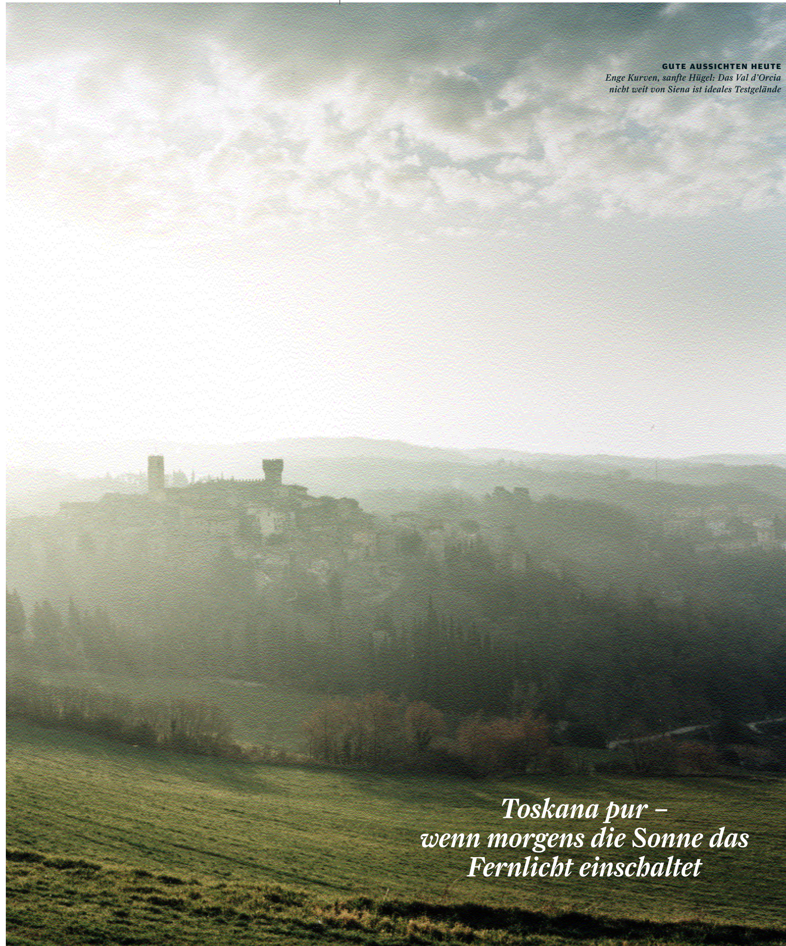
GUTE AUSSICHTEN HEUTE Enge Kurven, sanfte Hügel: Das Val d'Orcia nicht weit von Siena ist ideales Testgelände

6 | Azienda Pereti In Roccatederighi. Ein Landgasthof in einem malerischen Felsenest. DZ ab 90 Euro pro Person. www.agriturismo-pereti.com/indexTED.htm