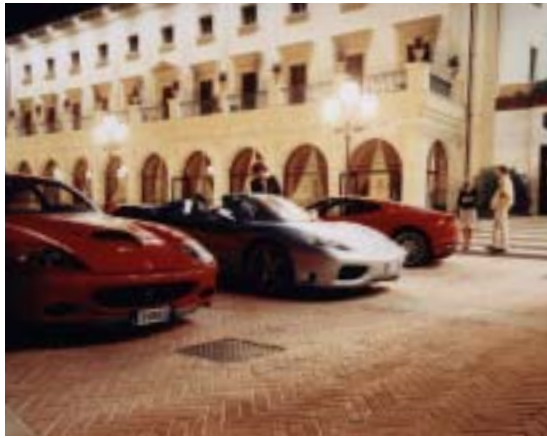
PROBIEREN WIR MORGEN DEN ZWÖLFZYLINDER, SCHATZ? Vor dem Hotel Fonteverde in San Casciano (von links): Ferrari 575M Maranello (515 PS), 360 Spider (400 PS), F430 (490 PS)