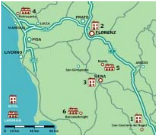
KARTE THOMAS ESCHER

Am einfachsten buchen Sie die Ferrari-Tour bei Red Travel (Tel. 00 39/0 11/6 16 52 19, www.red-travel.com ). Hier einige der schönsten Alternativen: